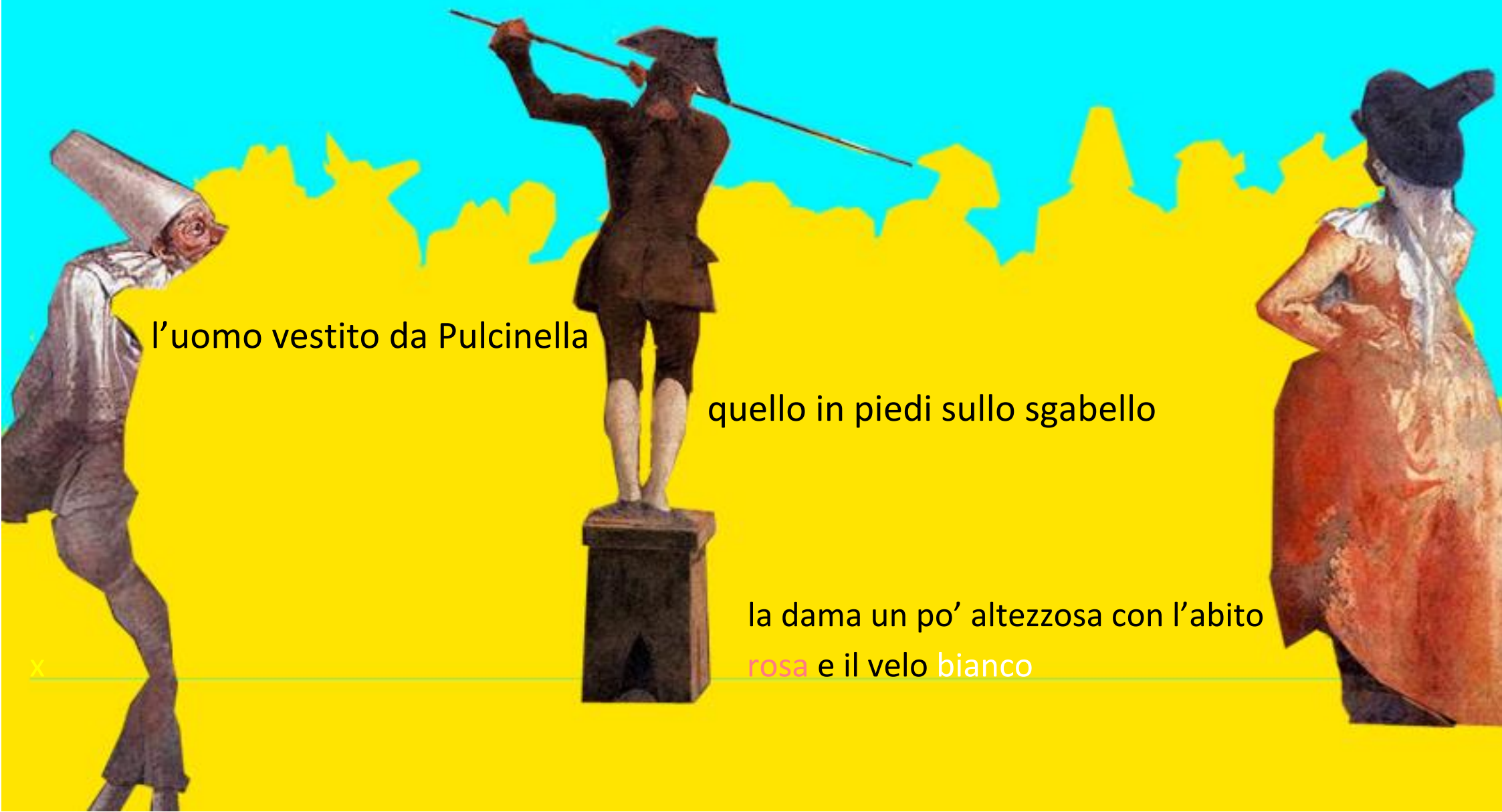
l'uomo vestito da Pulcinella

Che strano, dovevo essere proprio stanca. Ma cos'è tutto questo chiasso? E questa musica? Dove mi trovo? E quelle persone davanti a me mi ricordano tanto... i protagonisti del dipinto! Sì, certo, sono proprio loro!